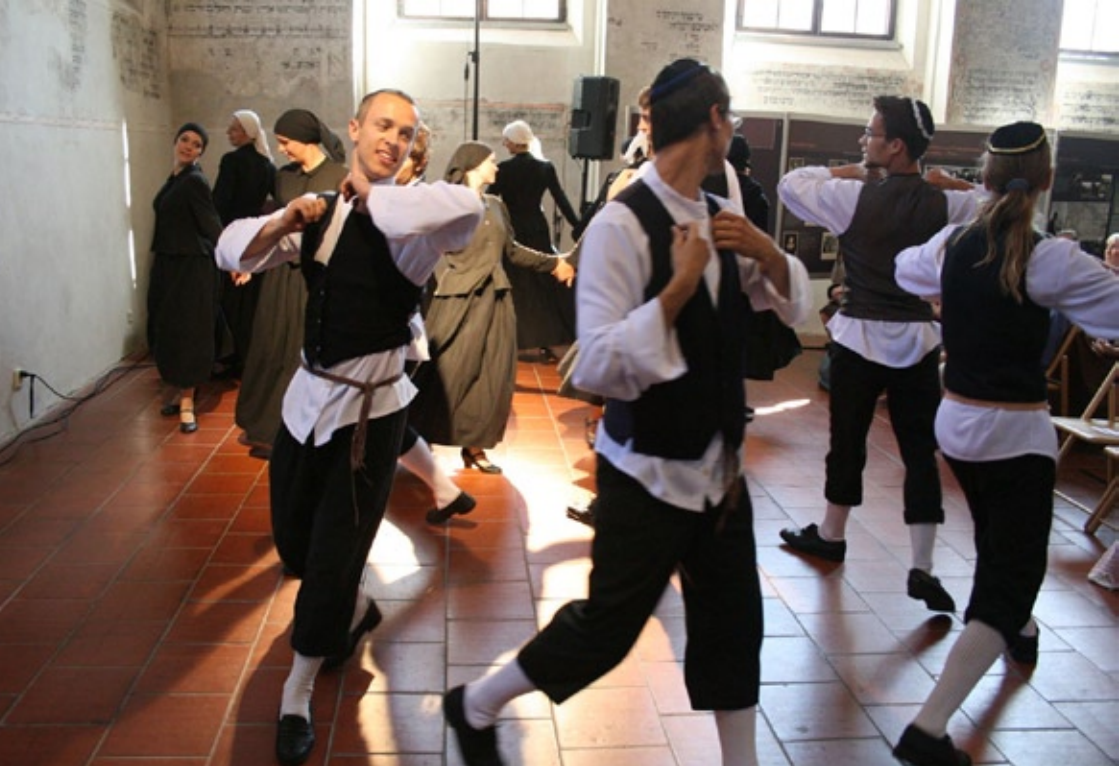
Třebíčský taneční soubor Yocheved provázejí od vzniku v roce 2004 pouze úspěchy. A nejen u nás.

zůstal posluchačům dlouho v paměti. Největší ocenění kromě potlesku? Asi upřímné slzy paní Marty Kottové.