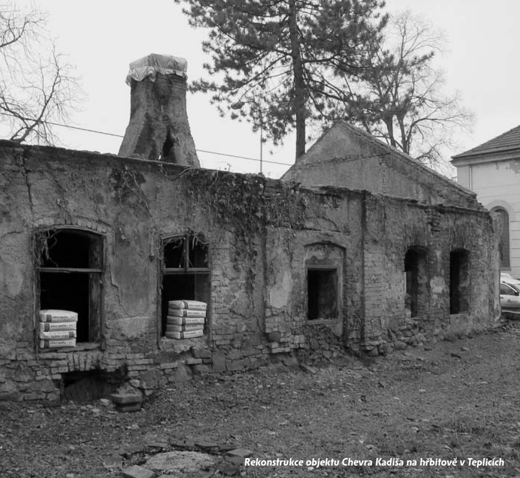
Rekonstrukce objektu Chevra Kadiša na hřbitově v Teplicích