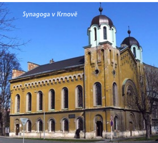
Synagoga v Krnově

Tento projekt si klade za cíl využít možnost získání finančních prostředků z Integrovaného operačního programu – 5.1, který podporuje projekty obnovy a využití ucelených tematických souborů kulturních památek ležících na území většiny regionů soudržnosti. Projekt je nutno realizovat centrálně kvůli vzájemné koordinaci jednotlivých oblastí a zajištění vzájemné součinnosti. Žadatelem v tomto projektu je Federace židovských obcí v ČR vzhledem k její celorepublikové působnosti.