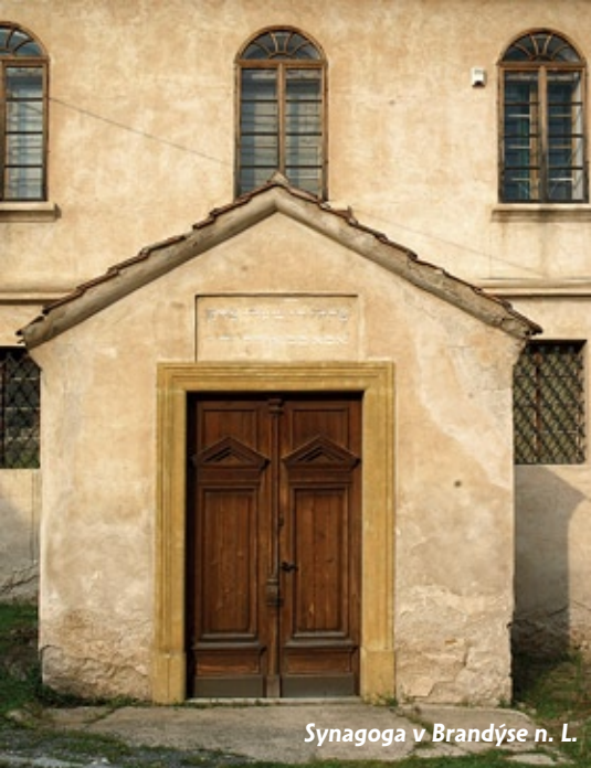
Synagoga v Brandýse n. L.