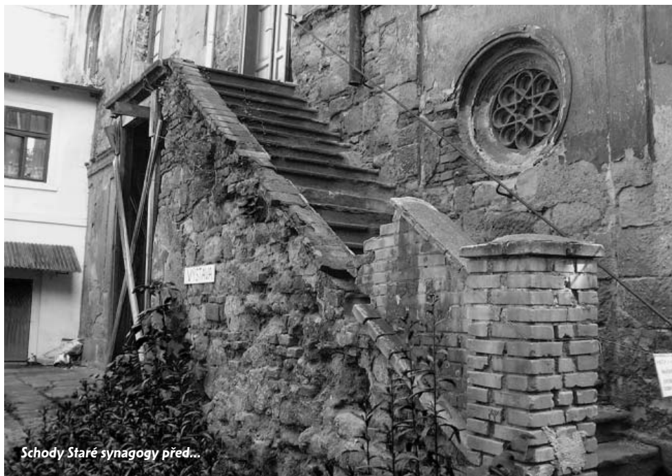
Schody Staré synagogy před...