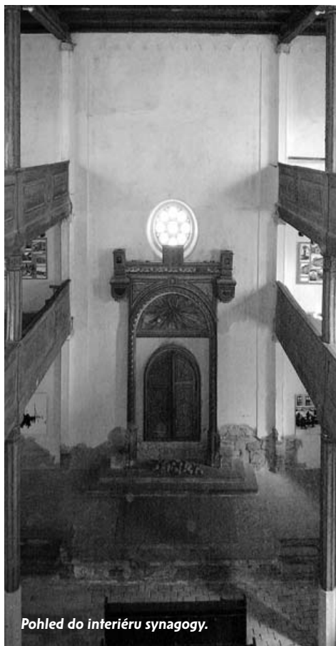
Pohled do interiéru synagogy.

tel.: 224 262 563, e-mail: poloucek@fondholocaust.cz