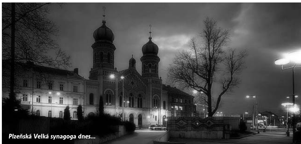
Plzeňská Velká synagoga dnes...

tel.: 224 262 563, e-mail: poloucek@fondholocaust.cz