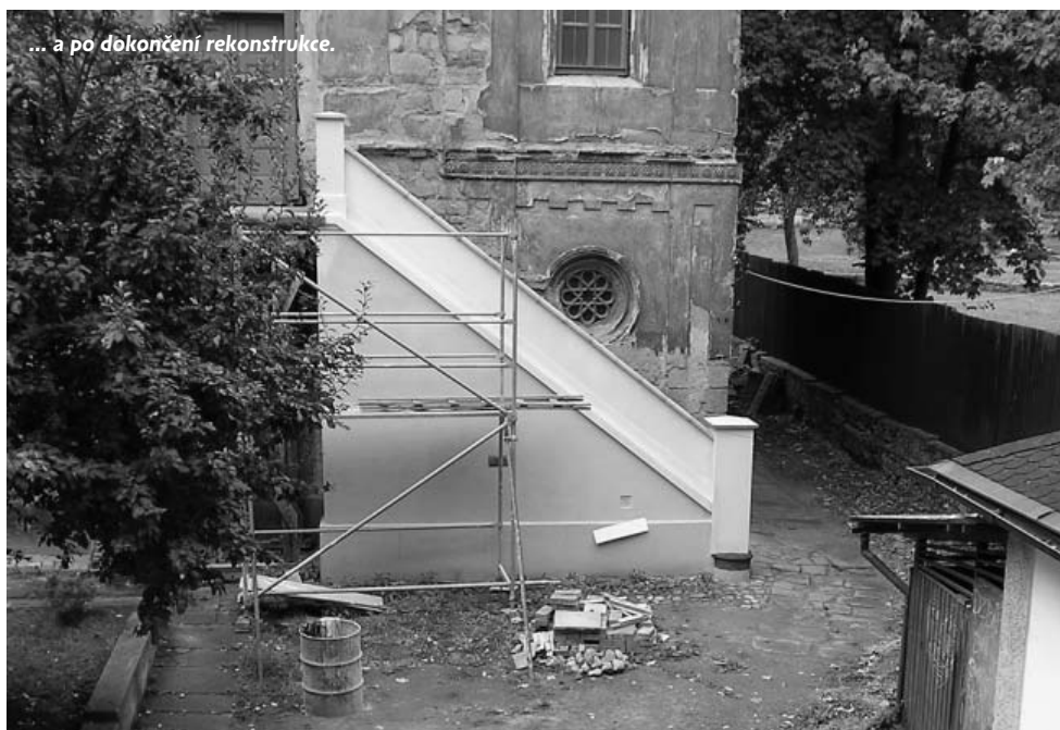
... a po dokončení rekonstrukce.